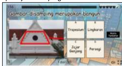
Gambar 3. Tampilan Pertanyaan

Bagian selanjutnya berupa tampilan soal, pada tampilan kuis berisi pertanyaan tentang pengenalan bangun datar yang dikaitkan dengan etnomatematika pada kebudayaan Jawa Timur. Terdapat 4 Jawaban pada setiap pertanyaan. Peserta didik diminta untuk memilih jawaban yang benar. Pada gambar 4 merupakan tampilan jawaban yang benar, dan pada gambar 5 merupakan tampilan jawaban yang salah.