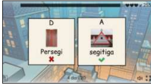
Gambar 4. Tampilan jawaban yang salah