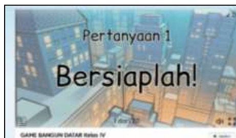
Gambar 2. Menu dan Persiapan

Pada gambar selanjutnya menunjukkan tampilan menu pertanyaan, terdapat 20 kuis yang wajib dijawab. Disetiap kuisnya memiliki jawaban berupa pilihan ganda a sampai d.