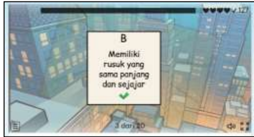
Gambar 5. Tampilan jawaban yang benar