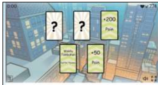
Gambar 7. Tambahan Waktu