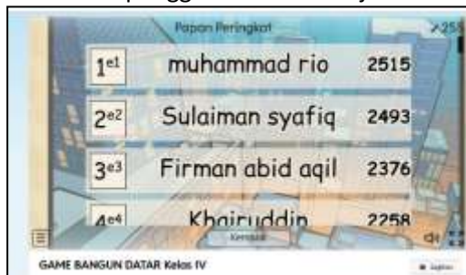
Gambar 8. Papan Peringkat

Pada gambar 8. Terdapat tampilan leaderboard atau papan peringkat untuk mengetahui sejauh mana tingkat keberhasilan pengguna dalam menjawab kuis.