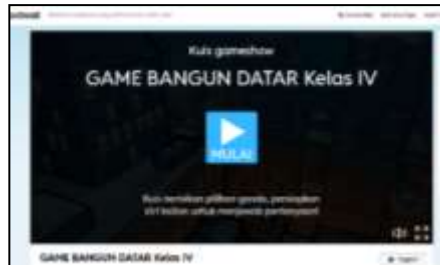
Gambar 1. Tampilan Awal

Tampilan awal gambar 1. Adalah Opening. Tampilan ini adalah pembuka game edukatif berbasis pendekatan etnomatematika sebelum memasuki ke halaman menu. Game bisa berganti template sesuai dengan yang diinginkan. Tekan tombol mulai untuk memulai permainan.