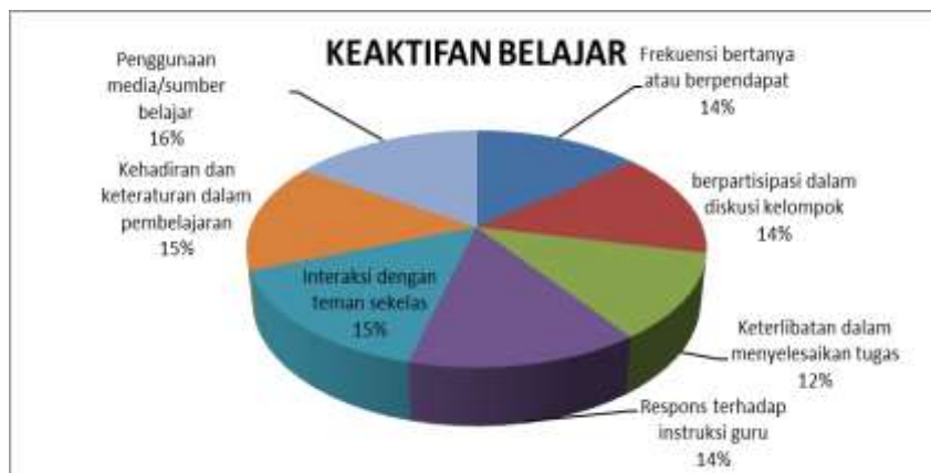
Gambar 2. Hasil Rekapitulasi Penyebaran Angket Tentang Keaktifan Belajar Kepada Siswa Kelas VII di SMPN 36 Bandar Lampung

Berdasarkan grafik pie chart, terlihat bahwa indikator dengan persentase terendah dalam keaktifan belajar siswa adalah "keterlibatan dalam menyelesaikan tugas" (12%). Hal ini menunjukkan bahwa sebagian besar siswa belum menunjukkan partisipasi aktif dan tanggung jawab penuh dalam menyelesaikan tugas-tugas pembelajaran. Permasalahan yang menonjol adalah rendahnya motivasi dan kesadaran siswa terhadap pentingnya keterlibatan dalam proses belajar mandiri maupun kolaboratif. Meskipun beberapa aspek keaktifan lain seperti penggunaan media atau kehadiran menunjukkan angka lebih tinggi, lemahnya keterlibatan dalam tugas mencerminkan adanya hambatan dalam penerapan pembelajaran yang menuntut kemandirian dan inisiatif siswa. Kondisi ini menuntut strategi pedagogik yang lebih mendorong keterlibatan aktif, seperti pemberian tugas yang bermakna, umpan balik yang konstruktif, serta metode yang menumbuhkan rasa tanggung jawab dan kepemilikan terhadap proses belajar.