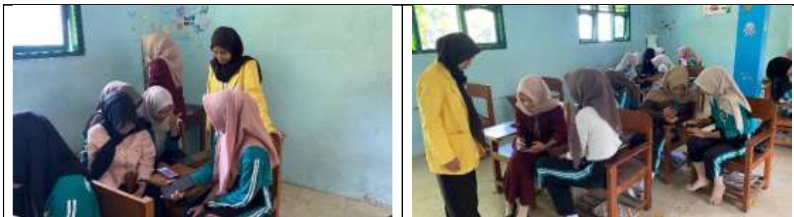
Gambar 1. Aktivitas siswa dalam pembelajaran menggunakan media Minipoli Sejarah

Berdasarkan hasil penelitian, nilai karakter yang muncul dalam pembelajaran menggunakan media Minipoli Sejarah: Misi Madinah Harmoni meliputi kerja sama, tanggung jawab, dan kejujuran. Nilai-nilai tersebut tampak melalui aktivitas siswa selama proses pembelajaran berbasis permainan yang melibatkan interaksi, diskusi, dan partisipasi aktif. Temuan ini juga didukung oleh dokumentasi aktivitas siswa selama pembelajaran menunjukkan adanya interaksi dan kerja sama dalam kelompok. Siswa terlibat aktif dalam permainan serta saling berdiskusi untuk menyelesaikan tugas yang diberikan.