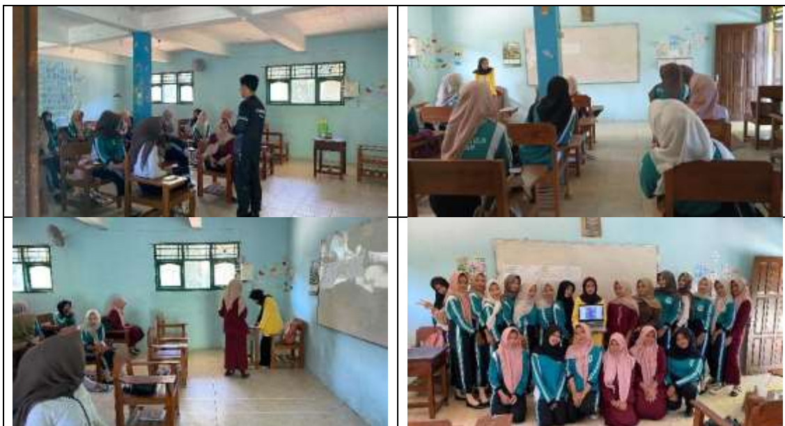
Gambar 3. Kondisi ruang kelas saat pembelajaran berlangsung di kelas X AK 1 SMK Khozinatul Ulum Todanan