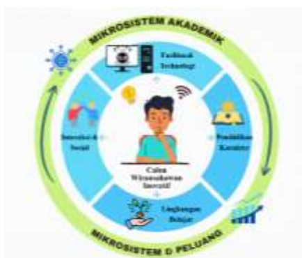
Gambar 2. Ekosistem Akademik Pembentuk Pola Pikir Mahasiswa

Kondisi ini sejalan dengan temuan dari Liu & Peng (2025) menegaskan bahwa lingkungan perguruan tinggi yang suportif merupakan pendorong terbesar bagi mahasiswa. Jika dukungan lingkungan ini dikombinasikan dengan pembentukan sikap dan keyakinan diri yang matang, maka orientasi mahasiswa akan berubah secara drastis. Mereka tidak akan lagi bergantung pada lowongan kerja yang ada sebagai job seeker , melainkan bertransformasi menjadi calon wirausahawan baru yang tangguh. Berikut merupakan visualisasi mengenai sinergi ekosistem akademik dalam memincu transformasi mentalitas wirausaha mahasiswa jika disajikan dalam bentuk gambar.