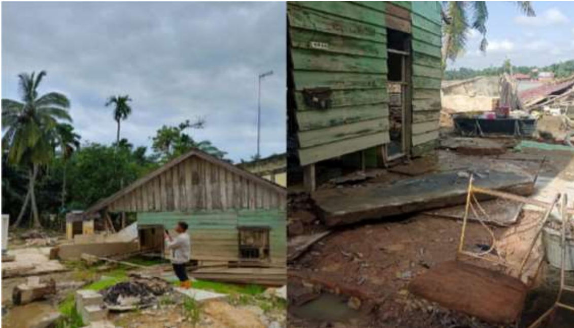
Gambar 2. Kondisi Masyarakat terdampak bencana banjir dalam krisis air bersih

Berdasarkan kondisi tersebut, diperlukan suatu solusi teknologi yang mampu menjawab kebutuhan air bersih masyarakat terdampak secara cepat, efisien, dan berkelanjutan. Pengembangan teknologi Smart Water Treatment System berbasis energi terbarukan dipandang sebagai solusi strategis untuk mendukung pemulihan layanan dasar air bersih (Masduqi, 2023). Teknologi ini diharapkan mampu menyediakan air bersih layak konsumsi bagi minimal 100–150 KK pada tahap awal implementasi, sekaligus mendorong peningkatan kualitas hidup masyarakat serta memperkuat ketahanan desa dalam menghadapi bencana serupa di masa mendatang