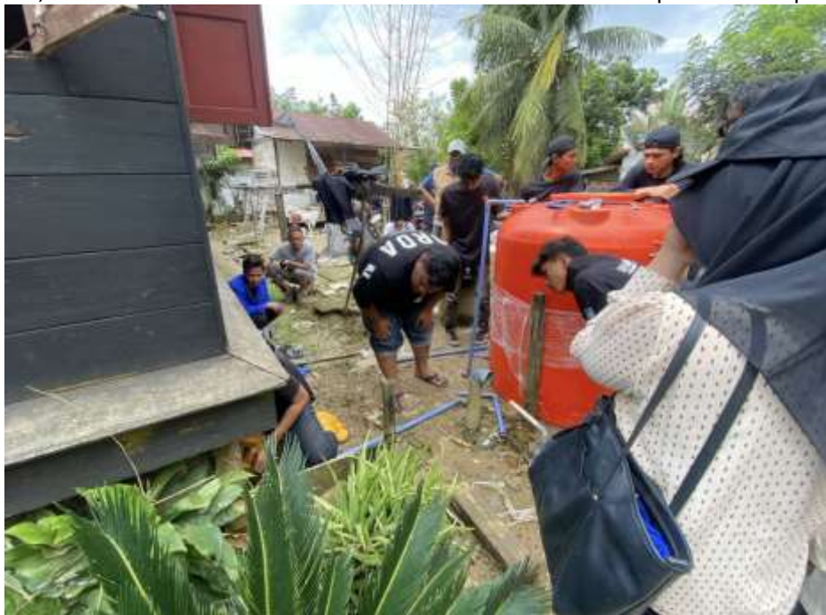
Gambar 6. Proses Instalasi Teknologi Smart Water Treatment Hybrid System

Pelaksanaan kegiatan pengabdian kepada masyarakat ini diawali dengan kegiatan sosialisasi dan koordinasi bersama mitra sasaran, yaitu pemerintah desa, kelompok pemuda desa, serta perwakilan masyarakat Desa Tualang Baru. Sosialisasi dilakukan untuk memberikan pemahaman mengenai tujuan program, manfaat kegiatan, serta tahapan pelaksanaan program yang akan dilakukan. Dalam kegiatan ini tim pelaksana memaparkan konsep penerapan teknologi Smart Water Treatment Hybrid System sebagai solusi pengolahan air bersih bagi masyarakat yang terdampak banjir. Selain itu, kegiatan ini juga bertujuan untuk membangun komitmen dan partisipasi masyarakat dalam mendukung keberhasilan program. Hasil dari kegiatan sosialisasi menunjukkan adanya dukungan yang baik dari pemerintah desa dan masyarakat, serta kesediaan mereka untuk terlibat secara aktif dalam pelaksanaan program.