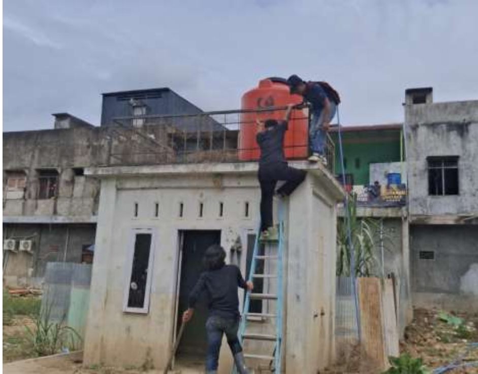
Gambar 7. Proses Akhir Pemasangan Alat

Setelah proses perancangan dan perakitan sistem selesai dilakukan, kegiatan dilanjutkan dengan tahap instalasi dan uji coba sistem pengolahan air di lokasi yang telah disepakati bersama mitra desa. Instalasi sistem dilakukan dengan memasang seluruh komponen teknologi mulai dari pompa air, unit filtrasi, tangki penyimpanan, hingga sistem distribusi air bersih. Setelah instalasi selesai, tim pelaksana melakukan pengujian terhadap kinerja sistem untuk memastikan seluruh komponen dapat berfungsi dengan baik. Hasil uji coba menunjukkan bahwa sistem mampu mengolah air baku yang sebelumnya memiliki tingkat kekeruhan tinggi menjadi air yang lebih jernih dan layak digunakan untuk kebutuhan sehari-hari masyarakat. Selain itu, sistem juga mampu beroperasi dengan memanfaatkan energi dari panel surya sehingga dapat mendukung operasional sistem secara berkelanjutan.