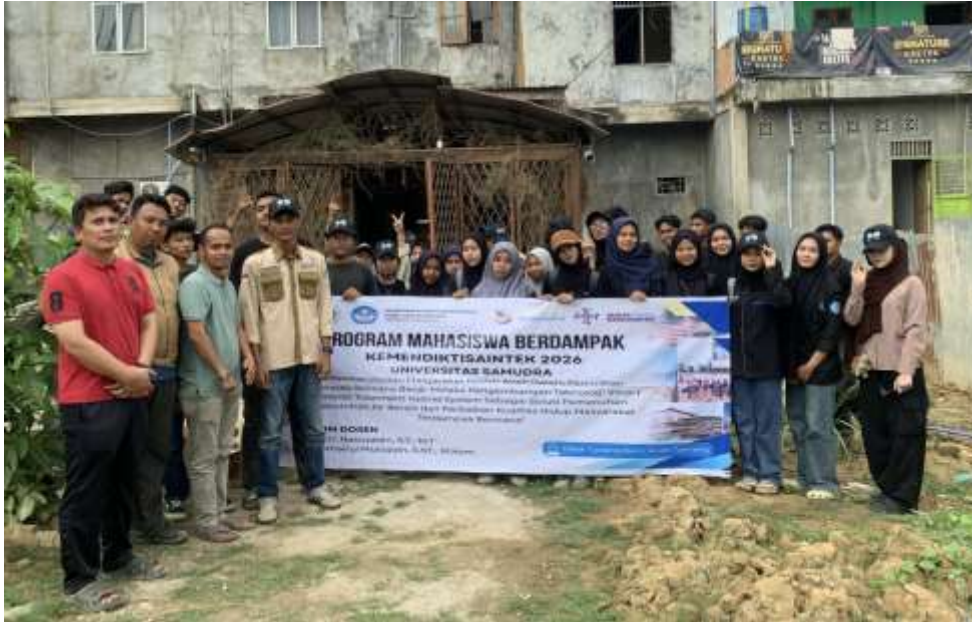
Gambar 8. Sosialisasi dan Evaluasi dengan Kelompok Mitra

penggunaan air bersih yang aman serta upaya menjaga keberlanjutan fasilitas yang telah dibangun melalui program pengabdian.