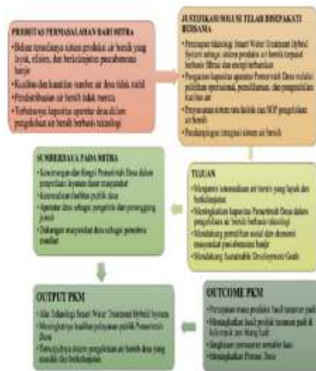
Gambar 3. Bagan Justifikasi Solusi Permasalahan Mitra Kelompok