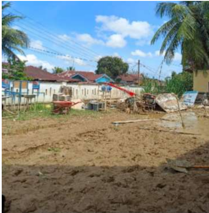
Gambar 1. Kondisi Terkini mitra pemerintahan desa tualang baru pasca bencana banjir

Desa Tualang Baru merupakan salah satu desa di Kecamatan Manyak Payed, Kabupaten Aceh Tamiang, yang terletak di kawasan pesisir dan berbatasan langsung dengan Selat Malaka. Desa ini berjarak sekitar 16 km dari pusat pemerintahan Kabupaten Aceh Tamiang, dengan luas wilayah \pm 4,20 km 2 yang terbagi ke dalam empat dusun, yaitu Dusun Keluarga, Paya Puntung, Pembangunan, dan Perantauan. Berdasarkan data administrasi desa, jumlah penduduk Desa Tualang Baru tercatat sebanyak 1.802 jiwa atau sekitar 420 kepala keluarga (KK), dengan mayoritas mata pencaharian berada pada sektor pertanian dan pekerjaan informal. Secara sosial ekonomi, lebih dari 60% kepala keluarga termasuk dalam kategori masyarakat berpenghasilan menengah ke bawah.