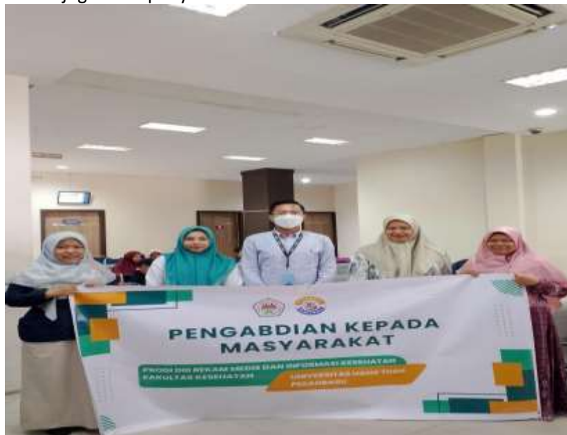
Gambar 3. Sosialisai Peningkatan Kualitas Isi Rekam Medis

Adapun Tahapan kegiatan pelaksanaan pengabdian masyarakat dimulai dari pembukaan dan memberikan salam kepada peserta, memperkenalkan tim dalam pengabdian kepada masyarakat, menjelaskan tujuan dan manfaat dari kegiatan pengabdian, menjelaskan materi penyuluhan yang akan diberikan kepada peserta. Setelah pembukaan maka dilanjutkan dengan memberikan Sosialisai Peningkatan Kualitas Isi Rekam Medis Sebagai Upaya Pencegahan Malpraktik Di Rumah Sakit X. Serta dilakukan penutup adalah menyimpulkan materi dari penyuluhan, mengucapkan terimakasih dan terakhir mengucapkan salam. Berikut dokumentasi saat melakukan kunjungan dan penyuluhan di Di Rumah Sakit X.