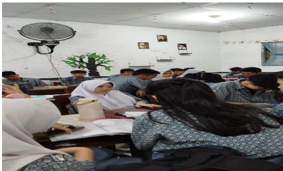
Melakukan penelitian kesekolah Dan Mengajar Les Bimbingan belajar gratis.