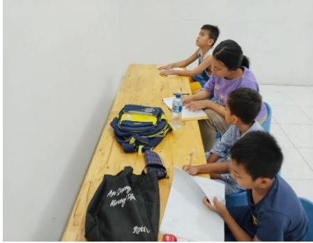
Mengajar Les Bimbingan belajar gratis Dan Mengajar sekolah minggu.