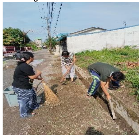
Membersihkan lingkungan di dekat gereja HKBP Menteng Medan.