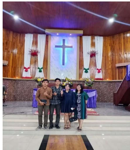
Mengikuti Ibadah dan membuat games dan manggang-manggang bonataon remaja naposobulung HKBP Menteng Medan.