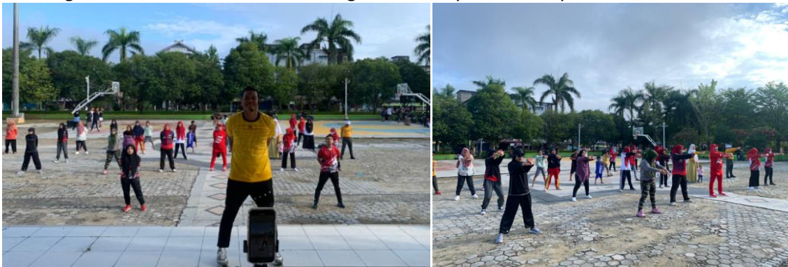
Gambar 3. Senam Jantung Sehat Bersama

Pada dasarnya, senam jantung sehat adalah senam yang dapat membuat detak jantung lebih cepat dan tubuh lebih berkeringat. Peran utama senam jantung sehat adalah memperkuat otot jantung, meningkatkan fungsi jantung, dan meningkatkan aliran oksigen ke seluruh tubuh. Pada kegiatan ini, diikuti oleh seluruh warga PKBM Zaliyah dan masyarakat Sekitar.