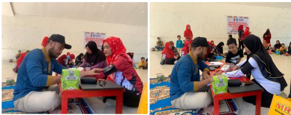
Gambar 2. Cek Tekanan Darah dan Konsultasi Kesehatan

Penyakit jantung masuk dalam daftar penyakit yang menyebabkan kematian terbanyak di Indonesia. Mulai dari serangan jantung, penyakit jantung koroner, gagal jantung hingga henti