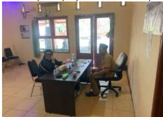
Gambar 2. Koordinasi dengan Kepala Desa Watuagung

Selain itu, tim pengabdian secara sistematis membuat rencana kegiatan. Ini termasuk menentukan jadwal, lokasi, dan tujuan peserta, serta membagi tugas antara anggota tim. Materi sosialisasi dan pendampingan disusun dengan bahasa yang mudah dipahami agar seluruh peserta dapat menerimanya. Selain itu, berbagai sarana pendukung, seperti modul, lembar informasi, media presentasi, dan instrumen evaluasi, disiapkan untuk memastikan kegiatan berjalan lancar dan memudahkan proses penyebaran informasi kepada peserta.