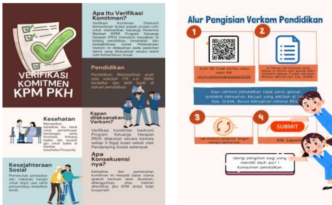
Gambar 4. Poster Pengertian Verifikasi Komitmen dan Poster tata cara pengisian verkom pendidikan

dalam mengisi, tim pengabdian membuatkan poster tata cara pengisian verifikasi komitmen pendidikan.