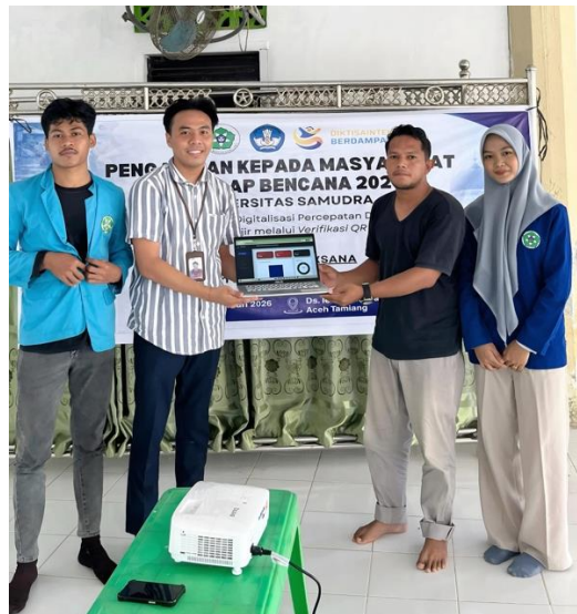
Gambar 2. Pelatihan Penggunaan Sistem QR-Relief e-Logistik (Dokumentasi kegiatan pelatihan operator sistem)