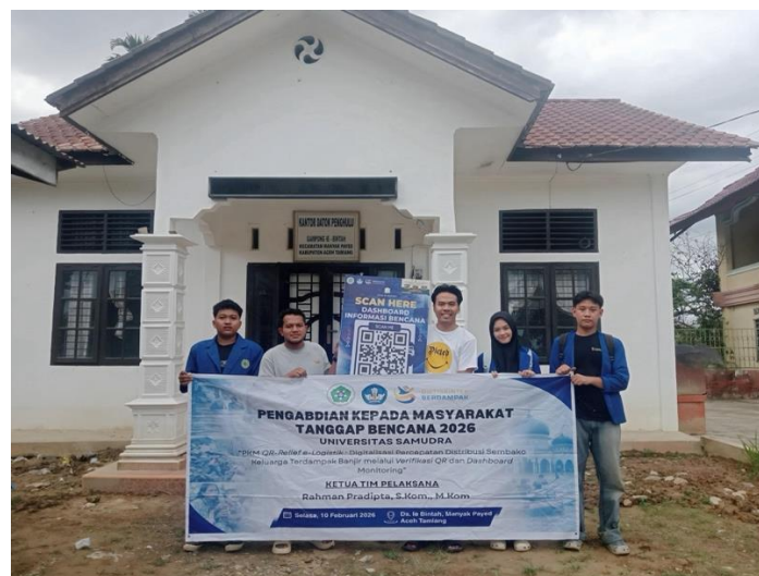
Gambar 3. Implementasi Pemindaian QR saat Distribusi Bantuan (Dokumentasi kegiatan lapangan)