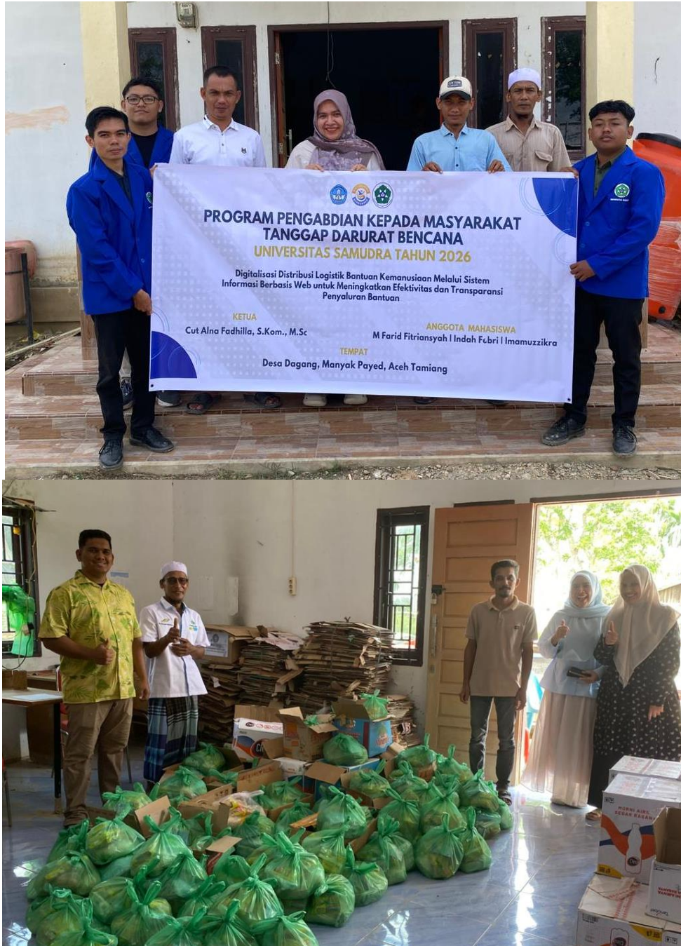
Gambar 3. Sosialisasi Sistem Informasi Dan Penyaluran Bantuan

Selain pengembangan sistem informasi, tim pengabdian juga melaksanakan kegiatan pelatihan bagi aparat desa dan relawan terkait penggunaan sistem yang telah dikembangkan. Pelatihan ini mencakup pengenalan antarmuka sistem, proses penginputan data penerima bantuan, pencatatan jenis logistik yang disalurkan, serta pemanfaatan fitur pemetaan lokasi bantuan. Untuk memperkuat pemahaman peserta, kegiatan pelatihan juga dilengkapi dengan simulasi distribusi bantuan menggunakan sistem sehingga aparat desa dan relawan dapat memahami alur kerja sistem secara praktis. Selain itu, tim juga menyusun panduan penggunaan sistem dalam bentuk modul sederhana yang dapat digunakan oleh aparat desa sebagai referensi dalam mengoperasikan sistem secara mandiri.