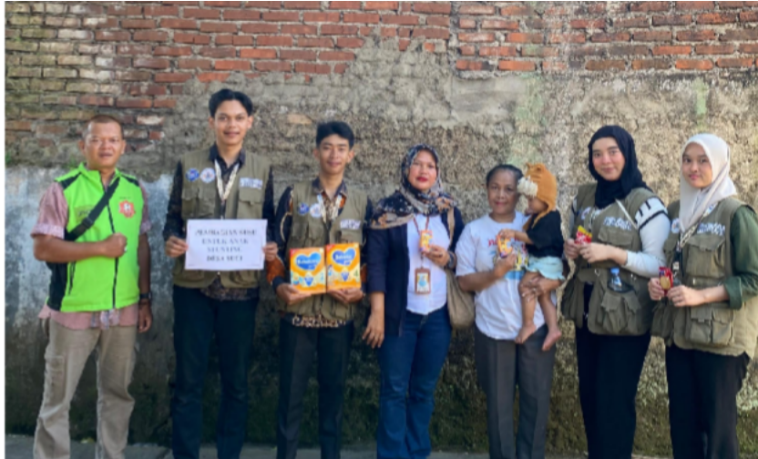
Figure 2. Penyaluran Program Pemberian Makanan Tambahan Di Desa Suci

Program pengabdian masyarakat yang tim pengabdian lakukan bersama pihak Desa Suci dan kader posyandu memberikan dampak positif, program ini pun berjalan secara berkelanjutan yang dilakukan oleh pihak desa dan kader posyandu untuk kedepannya.