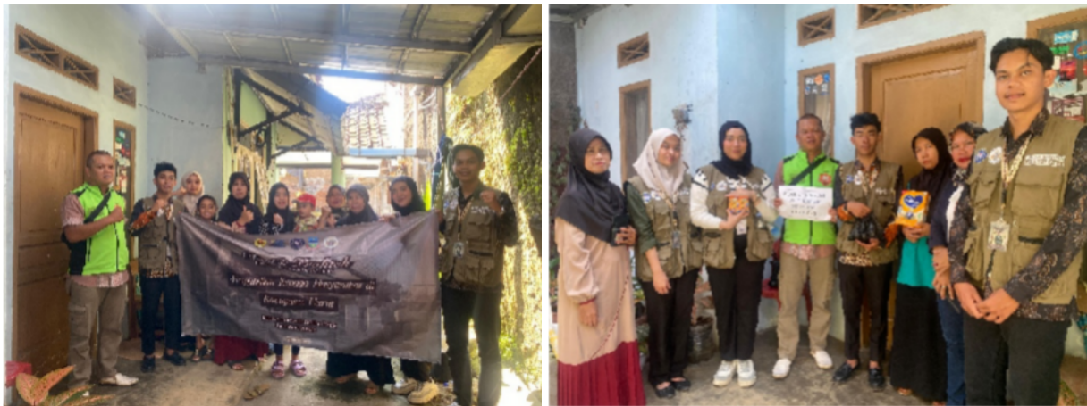
Figure 4. Penyaluran Program Pemberian Makanan Tambahan Di Desa Suci

Luaran untuk pelaksanaan program PMT ini adalah meningkatkan kualitas gizi anak – anak di desa suci kecamatan karangpawitan kabupaten Garut. Hal ini diharapkan Program PMT ini dapat dijadikan sebuah langkah dalam upaya pencegahan stunting di Desa Suci Kecamatan Karangpawitan Kabupaten Garut. Oleh karena itu, diharapkan Program PMT ini dapat terus berlangsung agar bisa membantu lebih banyak anak stunting dan ibu hamil.