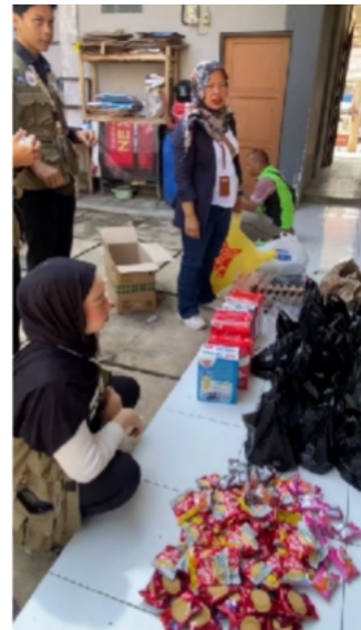
Figure 3. Keterlibatan Pemerintah Desa Dalam Program Pemberian Makanan Tambahan (PMT) Di Desa Suci Kecamatan Karangpawitan

Masyarakat ikut berpartisipasi mengikuti kegiatan ini khususnya pada saat penerimaan PMT tersebut, sebagai penerima manfaat mereka terdorong untuk memperbaiki kesehatan gizi. Mereka merasa senang dapat berpartisipasi karena kebutuhannya merasa tercukupi.